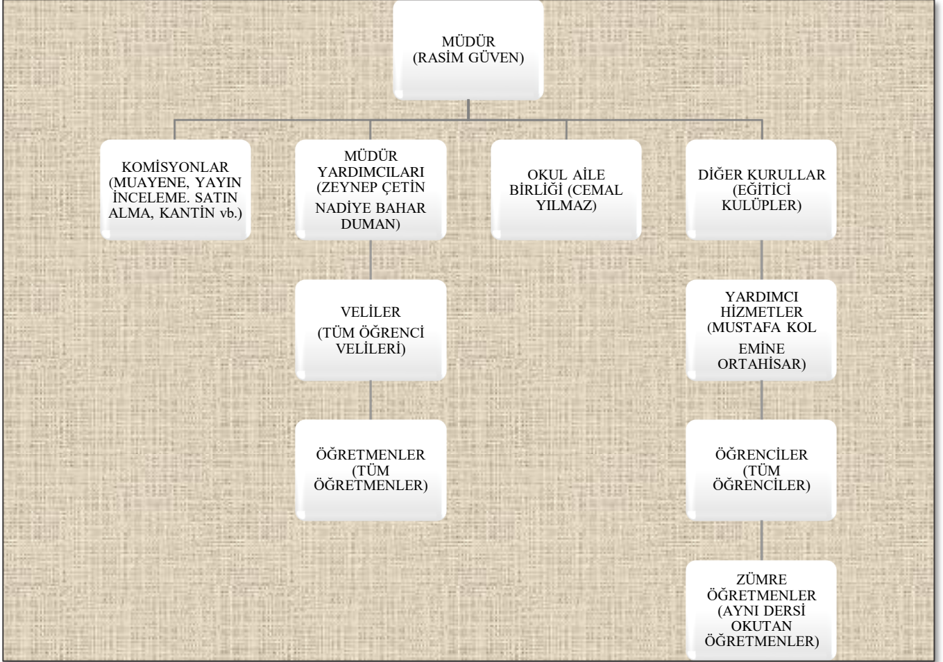
Şekil 3: Sürmene Cevdet Cavit Şenkaya Mesleki ve Teknik Anadolu Lisesi Teşkilat Şeması

Müdürlüğümüzün teşkilat yapısı ve birimlerin görevleri, 14.9.2011 tarihli ve 28054 sayılı Resmi Gazete' de yayımlanarak yürürlüğe giren 652 sayılı Millî Eğitim Bakanlığının Teşkilat ve Görevleri Hakkında Kanun Hükmünde Kararnamede düzenlenmiştir.